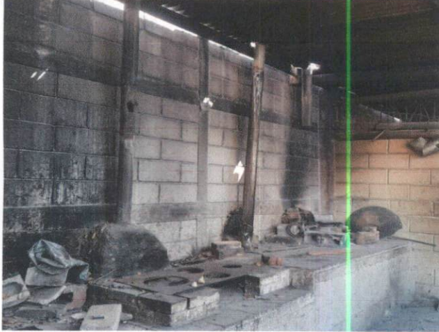
Foto1: Remozamiento de cocina